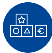
Kita-Zuschuss & Ferienbetreuung