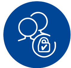
Pers. Betreuung durch feste Auszubildende