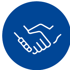
Sehr gute Übernahmechancen