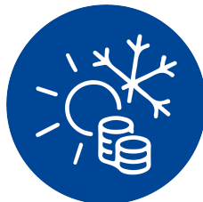
Urlaubs- und Weihnachtsgeld