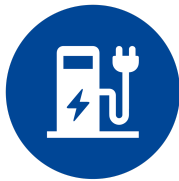
Ladestationen für E-Autos & E-Bikes